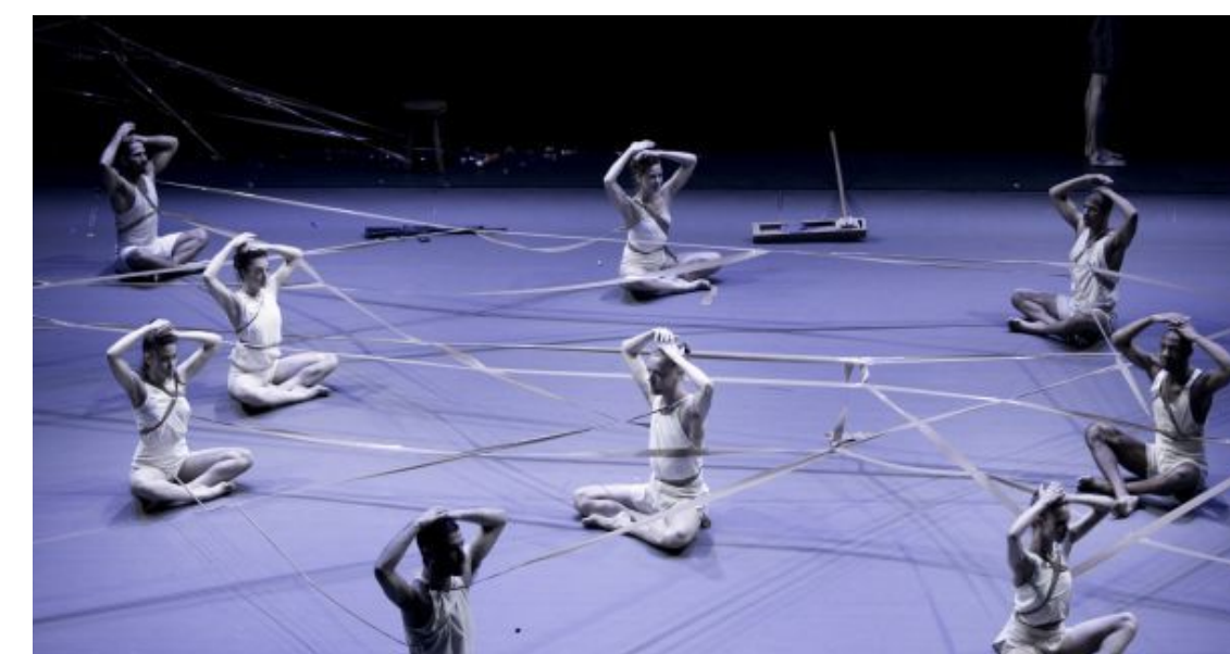
Last work, Batsheva Dance Company, Ohad Naharin