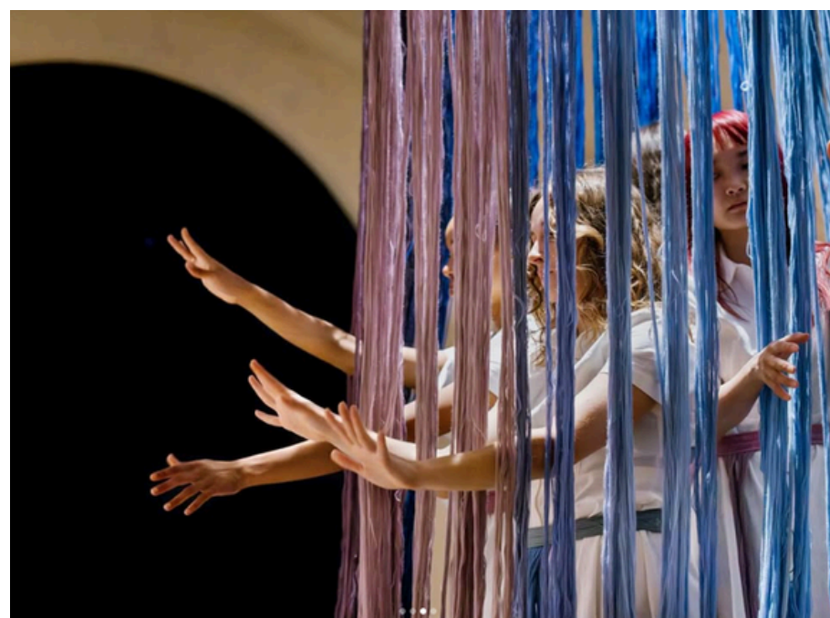
Le Sacre de la matière pour la Nuit des musées, Collectif minuit 12