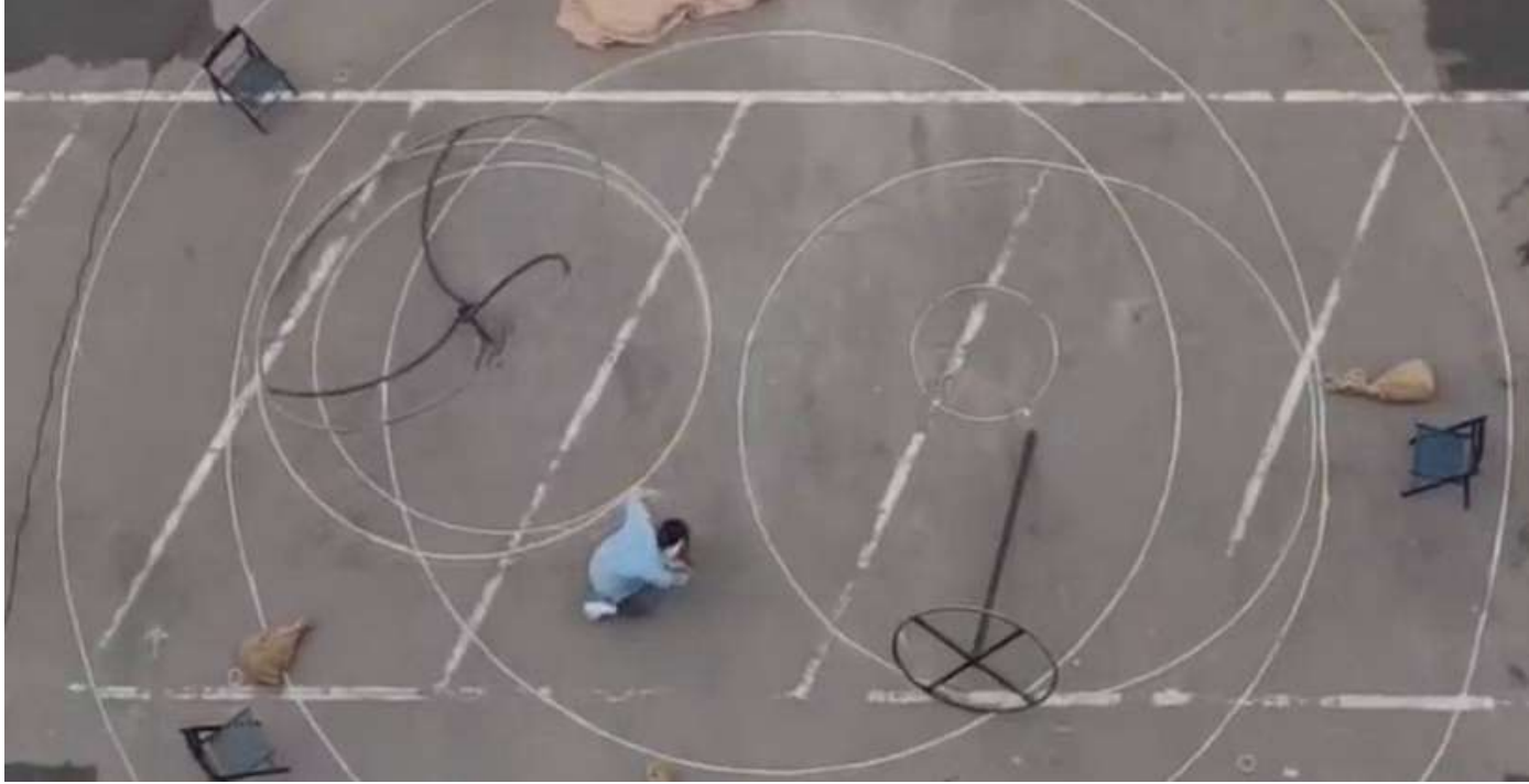
Travail de recherche

Jouer dans la rue, sortir des espaces dédiés au cirque pour jouer devant un public aléatoire, est ce qui m'anime. Captivés par l'image, le son, le visuel ou la position, ils s'arrêtent, et moi je capte leur regard, j'improvise parfois pour mieux les écouter. Le public est disposé sous la forme de « Halqa », un mode de présentation issu du Maroc dans lequel le public est en cercle autour du spectacle, cela crée une dynamique stimulante.