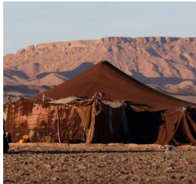
Inspiration : tentes amazighs nomades du sud du Maroc

De plus, ma volonté est de ne pas altérer les paysages dans lesquels je me produis. L'espace est préservé dans son état initial, il ne m'appartient pas, c'est un bien commun.